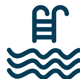
Piscina central con Solárium